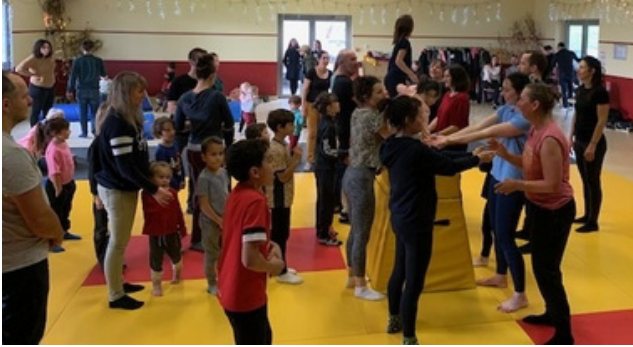
ATELIER DE CIRQUE PARENT-ENFANT ET ARRIVÉE DU PÈRE NOËL EN ULM!